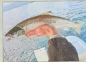
Une truite lacustre pêchée à la traîne.